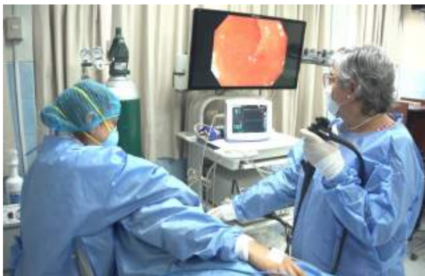
El policlínico ha implementado avances tecnológicos para brindar un mejor servicio.

El Policlínico Peruano Japonés se sustenta en cuatro pilares: la seguridad del paciente, su confort, la eficiencia y el crecimiento.