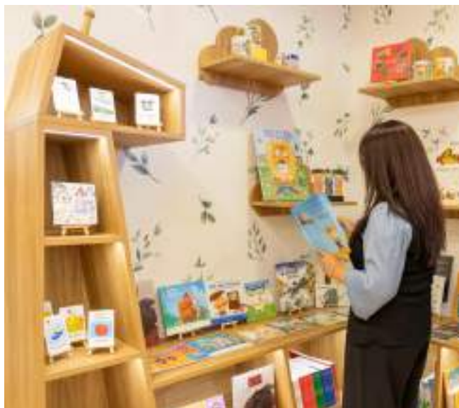
La librería cuenta también con libros infantiles.