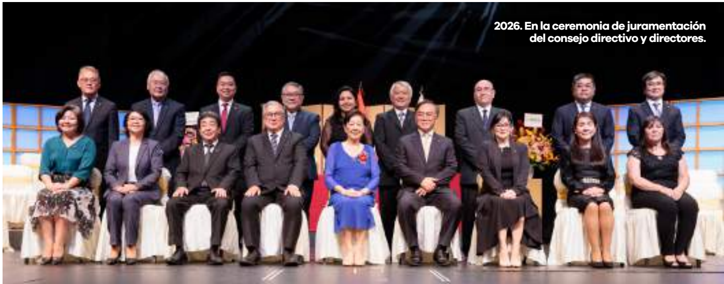
2026. En la ceremonia de juramentación del consejo directivo y directores.