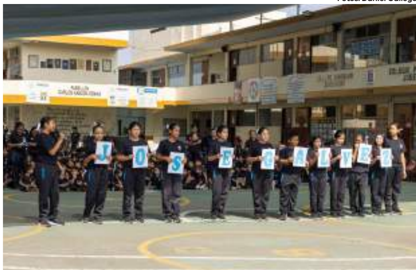
Alumnos galvinos en ceremonia conmemorativa.

matemáticas y las evaluaciones, que se realizaban cada trimestre, se hicieron mensuales con entrega de resultados a los padres, entre otras acciones.