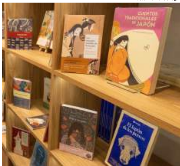
Publicaciones de literatura japonesa.