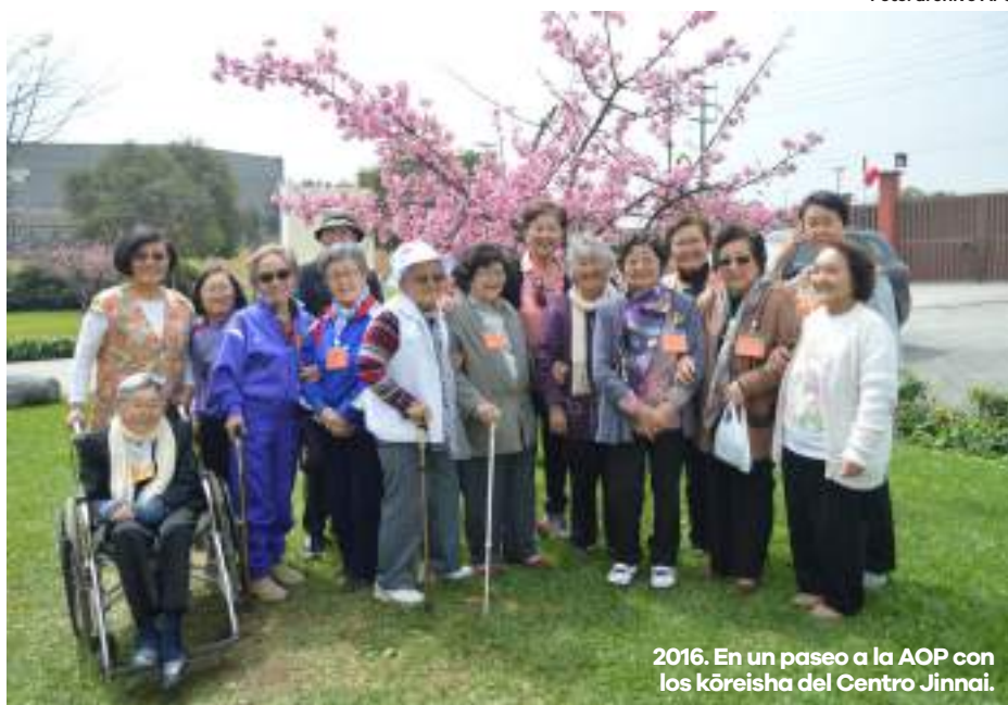
2016. En un paseo a la AOP con los kōreisha del Centro Jinnai.

Siempre he sido de la idea de que uno puede servir desde cualquier lugar, por eso la presidencia de la APJ nunca estuvo en mis planes ni fue una aspiración personal. Sin embargo, un grupo de amigos y compañeros en-