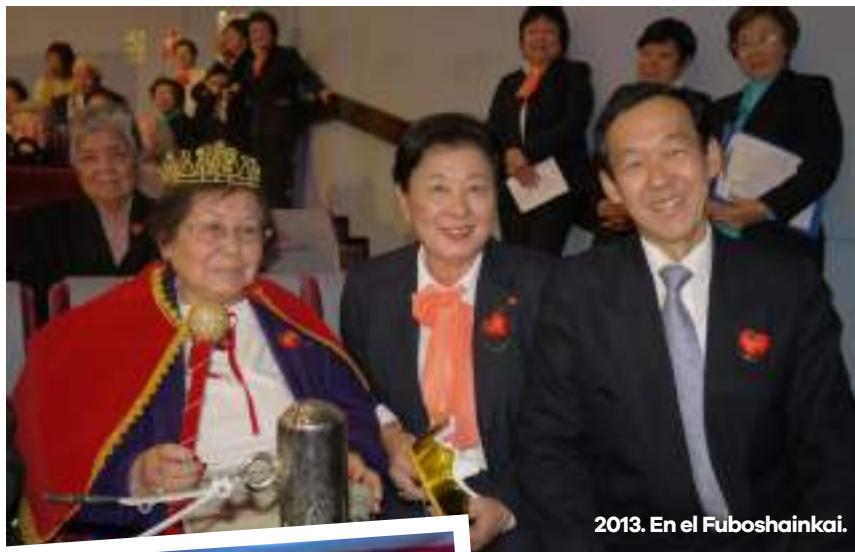
2013. En el Fuboshainkai.