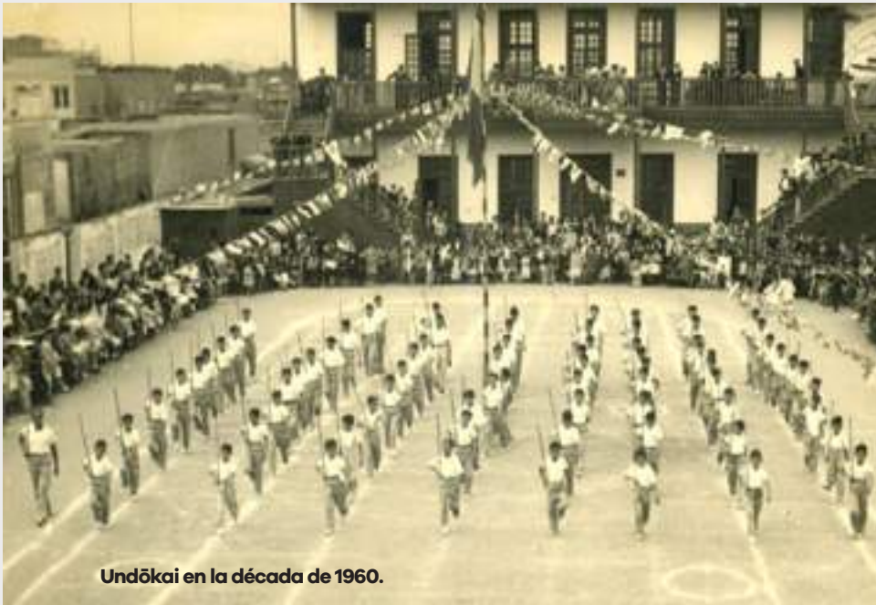
Undōkai en la década de 1960.