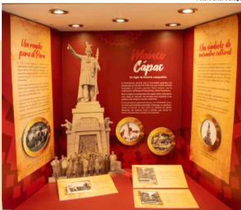
Develación del monumento.

El Museo de la Inmigración Japonesa al Perú "Carlos Chiyoteru Hiraoka" exhibe en la hornacina del hall del Centro Cultural Peruano Japonés la muestra "Manco Cápac: un siglo de historia compartida".