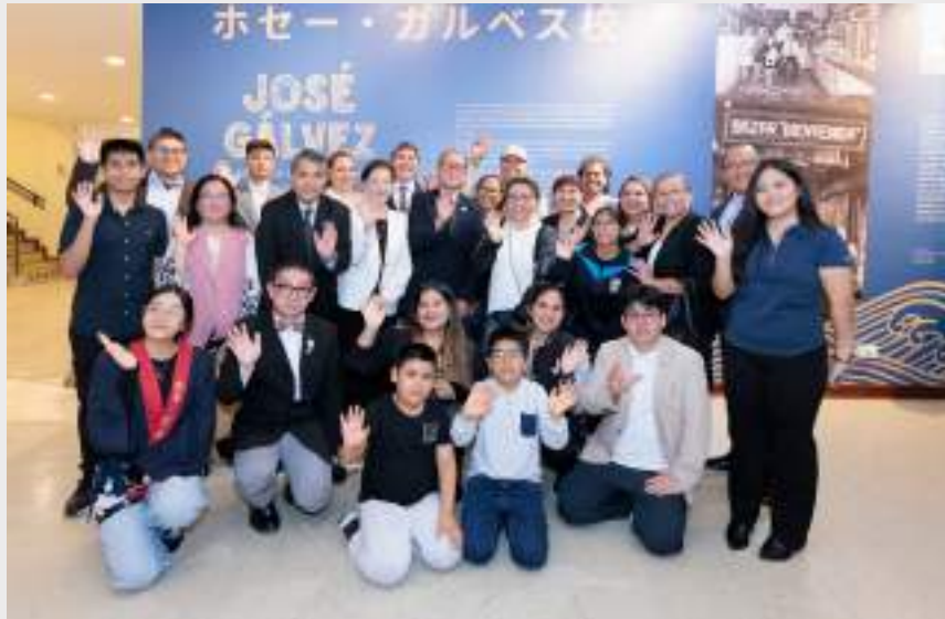
En la inauguración de la exposición conmemorativa en el Centro Cultural Peruano Japonés.

prácticas universitarias en la compañía DP World Callao atrajeron la mirada del jefe de su área por la manera en que ordenaban todo.