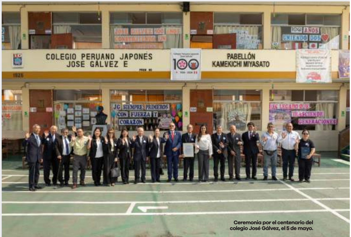
Ceremonia por el centenario del colegio José Gálvez, el 5 de mayo.

nalizaran las 5S. “Sin darse cuenta comenzaron a portarse mejor”, dice.