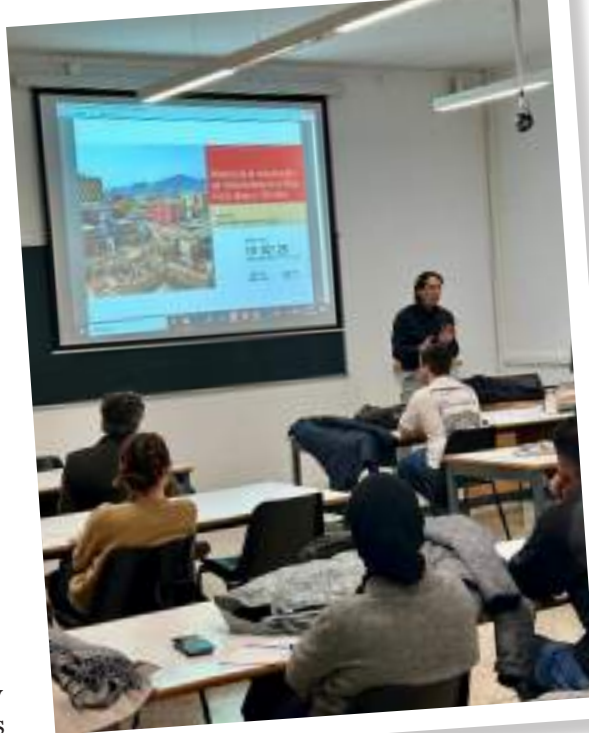
Disertación del arquitecto nikkei en Madrid.

dera”, dueño de un aserradero y una fábrica de artículos de jebe en La Victoria, donde se hacían los neumáticos de los autos de Ford.