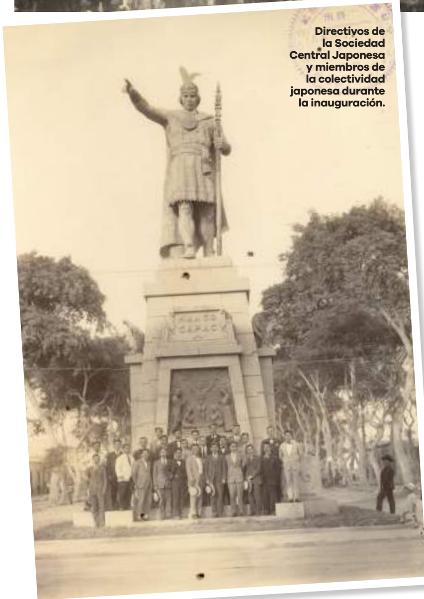
Directivos de la Sociedad Central Japonesa y miembros de la colectividad japonesa durante la inauguración.

mañana del 15 de agosto de 1922, una multitud se congregó en el cruce de las avenidas Grau y Santa Teresa para la colocación de la primera piedra.