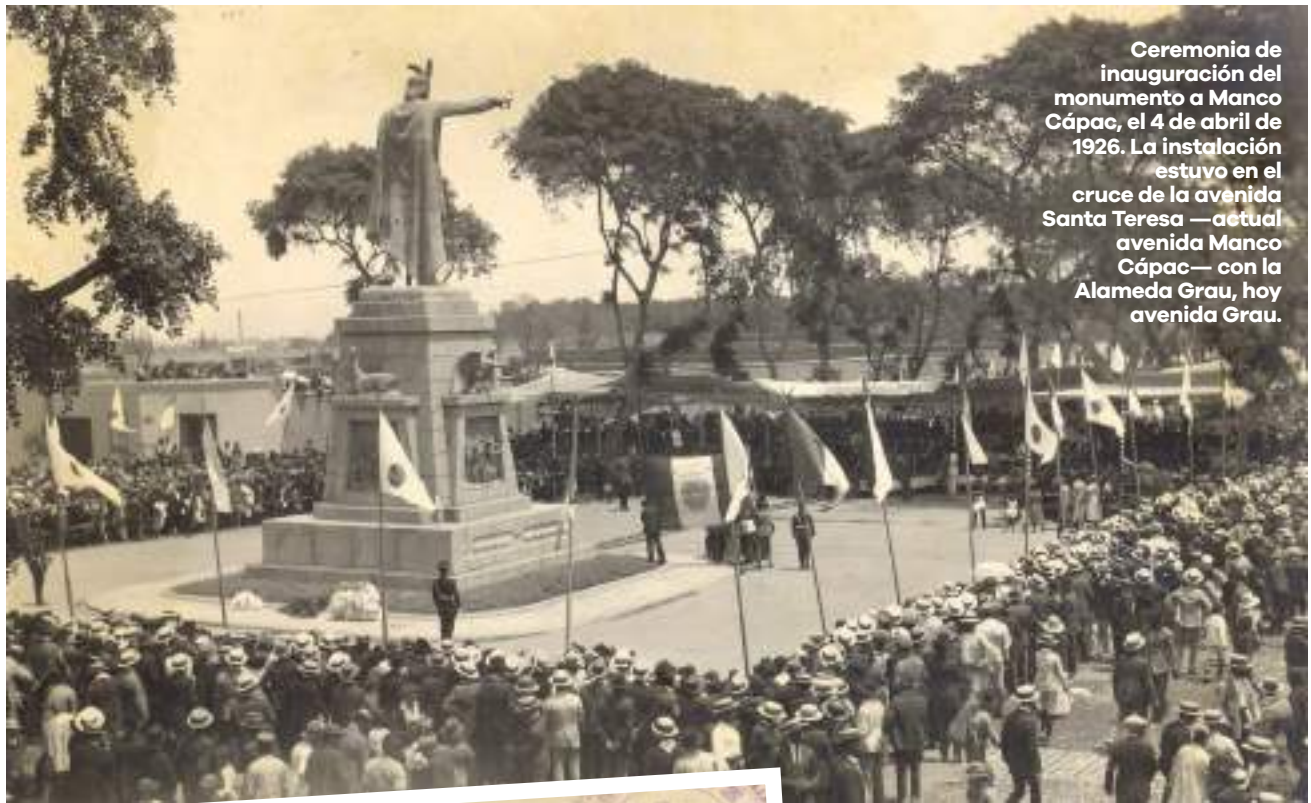
Ceremonia de inauguración del monumento a Manco Cápac, el 4 de abril de 1926. La instalación estuvo en el cruce de la avenida Santa Teresa —actual avenida Manco Cápac— con la Alameda Grau, hoy avenida Grau.