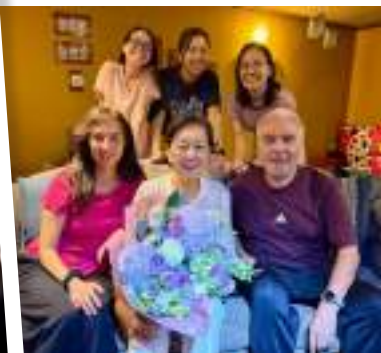
2026. Rodeada de su familia, en reciente celebración por el Día de la Madre.