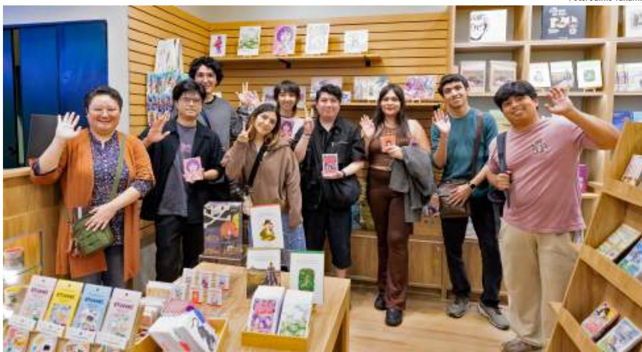
Artistas nikkei presentes en la inauguración de Kotodama.