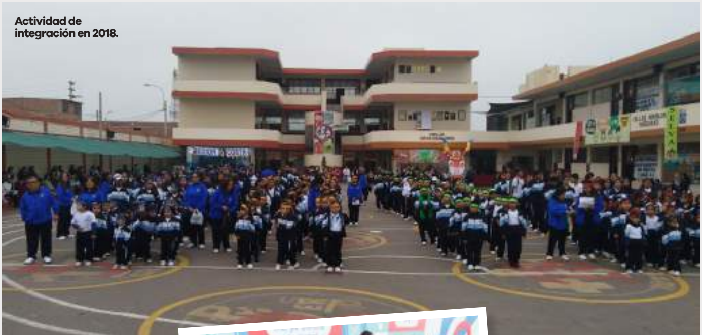
Actividad de integración en 2018.

de los beneficios de las 5S. ¿Cómo? Extrapolándolas al hogar a través de sus hijos.